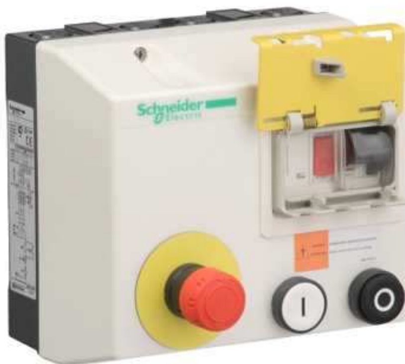
Układ rozruchowy LG i LJ serii TeSys wyposażony w wyzwalacz GVA385