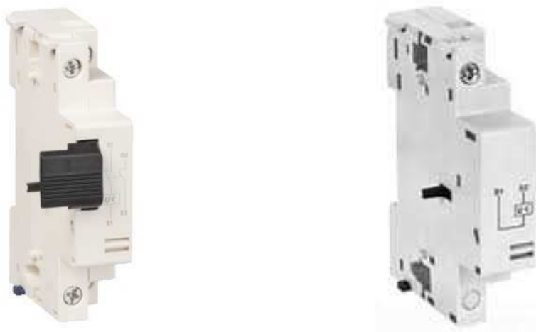
Wyzwalacz GVAX (po lewej) i GVAU (po prawej) serii TeSys